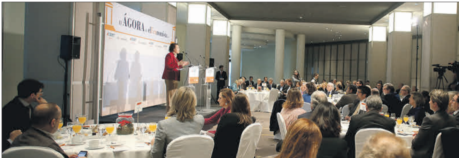
Éxito de convocatoria al Ágora con la ministra de Trabajo, Migraciones y Seguridad Social, Magdalena Valerio, celebrado ayer en el hotel The Westin Palace Madrid.