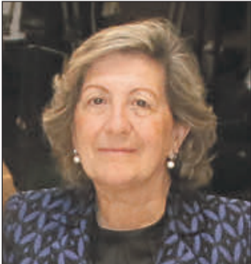
Pilar González de Frutos, presidenta de Unespa.