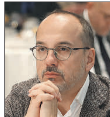
Carles Campuzano, portavoz del PDeCat en el Congreso.