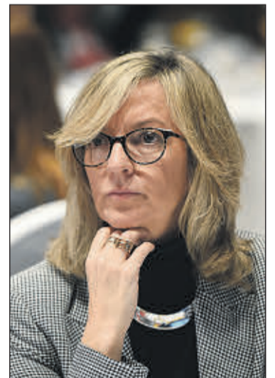
Mercè Perea Conillas, diputada del PSC y portavoz del Pacto de Toledo.