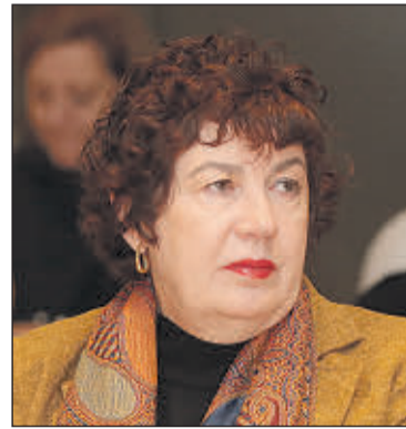
Estrella Rodríguez, dir. gral. de Integración y Atención Humanitaria.