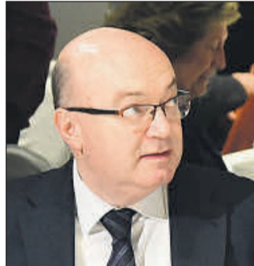
Raúl Riesco, subsecretario del Ministerio de Trabajo, Migraciones y S.S.